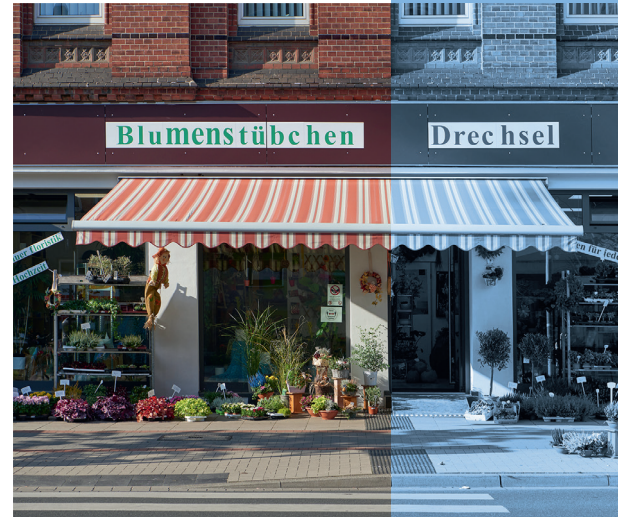
SCHEIDESTRAßE 35 Aufwendige Sanierung des ehemaligen Reformhauses.

In der Scheidestraße 35 wurde eine aufwendige Sanierung des ehemaligen Reformhauses durchgeführt. Das Gebäude wurde im Innenbereich entkernt und auf aktuellem Stand der Technik wieder hergerichtet. Zudem wurden die gesamte Fensterfront und der Eingangsbereich erneuert, sodass das Gebäude heute in neuem Glanz erstrahlt. Nach Beendigung der Sanierungsarbeiten konnte ein neu gewonnener Gewerberaummieter mit einem Blumenladen die Arbeit aufnehmen und das Nahversorgungsangebot in Kleefeld erweitern.