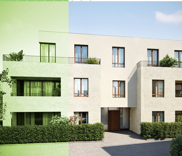
AM SEELBERG Fünf Wohnhäuser mit 25 Wohnungen in Misburg.