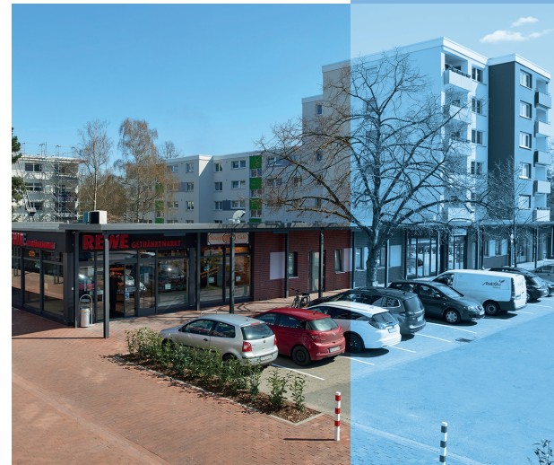
AHLDENER STRASSE 3, 5, 7, 9 Aufwendige Flachdachsaniierungen.

Auch am Wohn- und Verwaltungsgebäude in der Berckhusenstraße 16 konnten Maßnahmen zur Verbesserung der genossenschaftlichen Energiebilanz umgesetzt werden. So wurde im September 2020 die erste Ausbaustufe einer Photovoltaikanlage auf dem Verwaltungsdach fertiggestellt. Die Anlage versorgt die Verwaltung seitdem mit klimaneutralem Sonnenstrom und deckt schon heute etwa 20 % des gesamten Energiebedarfs der Verwaltung ab. Eine Erweiterung der Anlage ist für das Geschäftsjahr 2021 geplant.