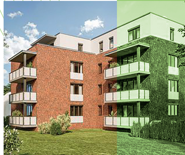
SCHWERINER STRAÙE Mehrfamilienhaus mit 10 Wohnungen in Kleefeld.

Zwei Neubauprojekte werden als Nachverdichtungsmaßnahmen in Kleefeld und Misburg auf genossenschaftseigenen Grundstücken realisiert. Die Anforderungen des energetischen Standards KfW 55 werden erfüllt und die Projekte werden jeweils zu 25 % öffentlich durch die Stadt Hannover gefördert. Der Bau von 26 modernen Wohnungen in der Albrechtstraße startete bereits im Jahr 2019. Die Fertigstellung und Übergabe der Wohnungen ist für April 2021 vorgesehen. So ergänzt schon bald ein modernes Mehrfamilienhaus mit 2-, 3- und 4-Zimmer-Wohnungen den Bestand der Genossenschaft. Die Nachverdichtungsmaßnahme in der Schweriner Straße wurde im Herbst 2020 begonnen. Es werden insgesamt 10 Wohnungen zwischen 51 qm und 105 qm realisiert. Die Baufertigstellung ist zum Ende des Jahres 2021 geplant, sodass ab Januar 2022 die Übergabe der Wohnungen erfolgen kann.