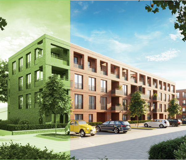
VITALQUARTIER SEELHORST Drei Häuser mit 44 Wohnungen in der Nähe der Seelhorst.