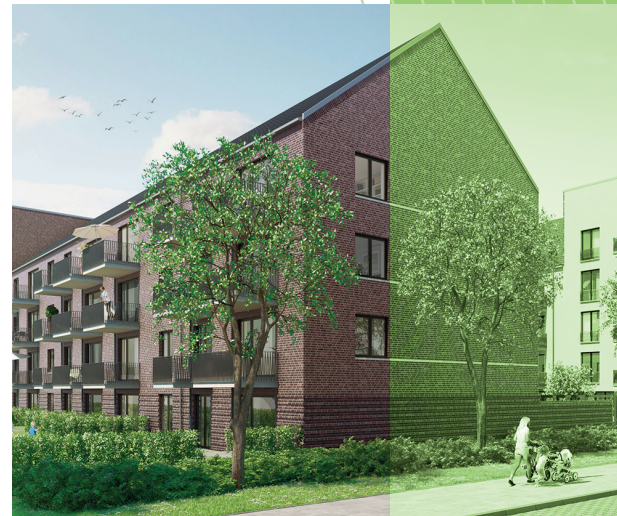
KLEEFELDER HOFGÄRTEN Häusergruppe mit 83 Wohnungen in Kleefeld.

Eine neue Kindertagesstätte und fuÙläufig erreichbare Nahversorgungsangebote runden das Gesamtpaket ab. Mit der Realisierung beider Bauabschnitte wurde im vergangenen Geschäftsjahr 2020 begonnen. Mit der Fertigstellung rechnen wir Mitte des Jahres 2022. Wie auch bei den Folgeprojekten sind jedoch aufgrund der Corona-Pandemie Fertigstellungszeitpunkte nur bedingt planbar.